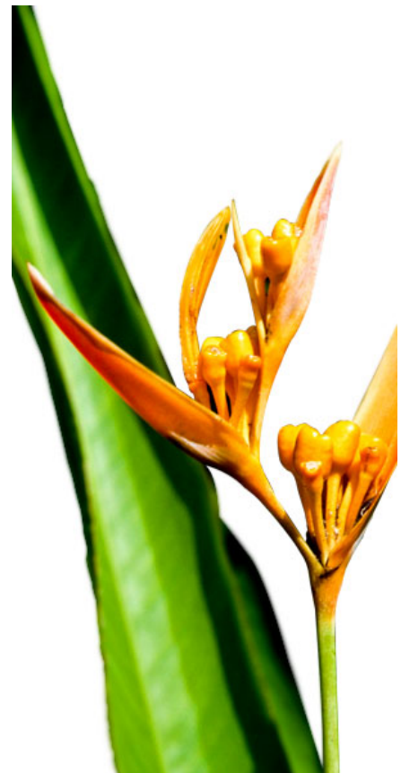
Grenada Un'isola speciale