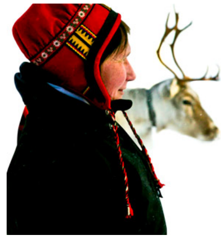
Laponia svedese Alla ricerca delle aquile reali